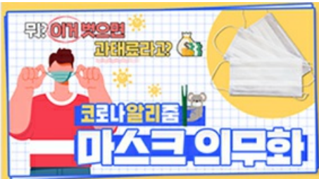
[코로나 뭐든 알리 줌 3편] 뭐? 이거 벗으면 과태료 부과?! 마스크 의무화의 모든 것